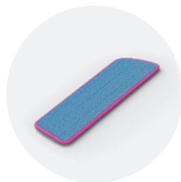
Mop de curățare QSSPRAYMOP