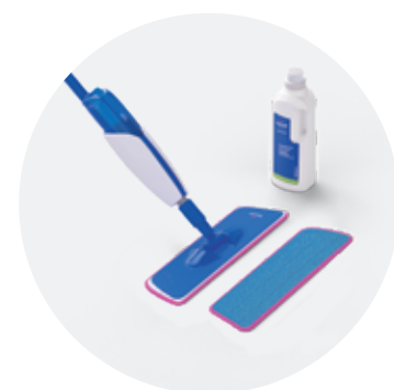
Trusă de curățare QSSPRAYKIT