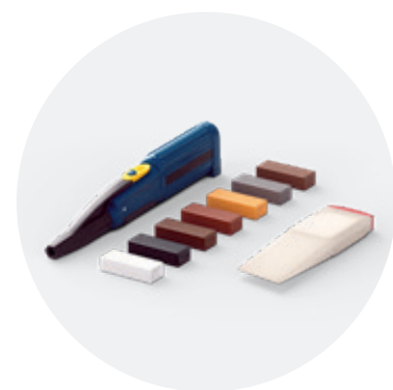
Trusă de reparații QSREPAIR